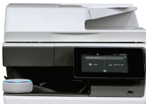
MX-C304W se muestra con la función de Voz MFP de Sharp disponible con la tecnología Alexa.

"Alexa, pide a la copiadora Sharp que escanee para mí".