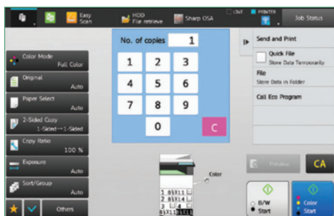
La Pantalla de Copiado estándar ofrece funciones más avanzadas.