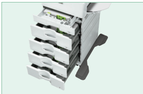
Ambos modelos ofrecen hasta seis fuentes de papel para una capacidad máxima de 2,700 hojas (se muestra con bandejas opcionales).

Desde el manejo del papel hasta la conexión en red, los sistemas compactos de documentos a color MX-C303W y MX-C304W excederán sus expectativas.